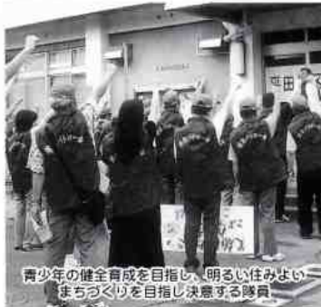
青少年の健全育成を目指し、明るいまちづくりを目指し決意する隊員