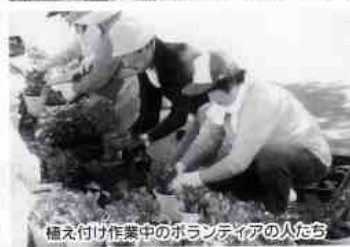
植え付け作業中のボランティアの人たち