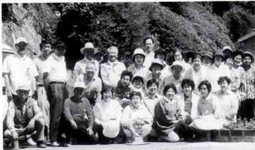
岩国市長と共に植え替え作業で、心地よい汗を流したボランティアの人たち