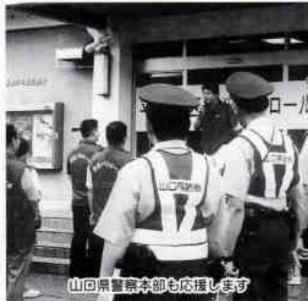
山回県警察本部も応援します