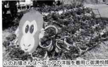
このお猿さんはベゴニアの洋服を着用し御満悦願